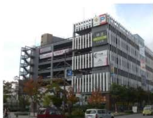
トイゴパーキング