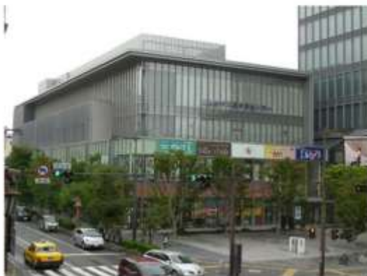
生涯学習センター(3・4階)